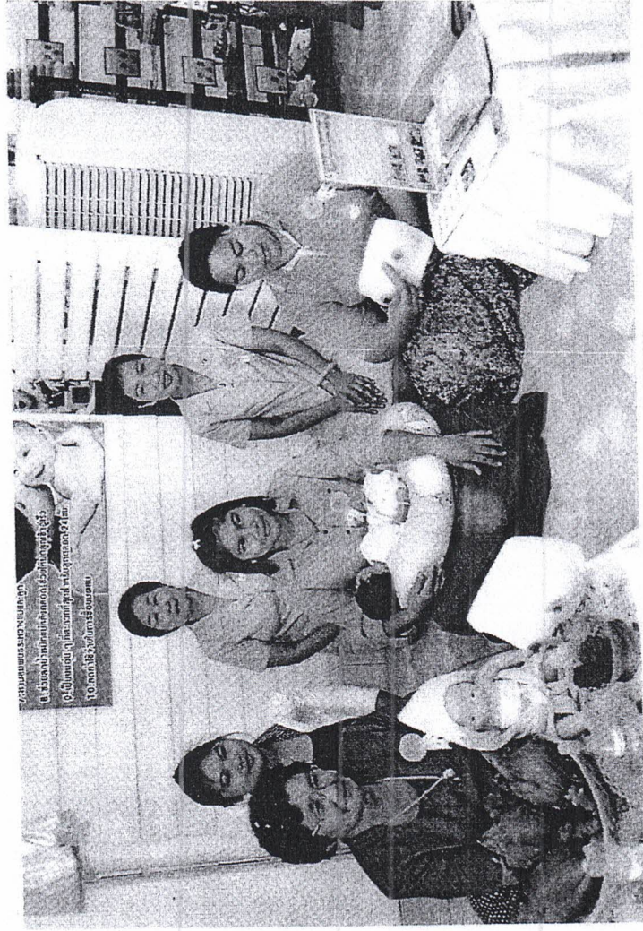
องค์การบริหารส่วนตำบลบางลึก อำเภออัมพวัน จังหวัดฉะเชิงเทรา